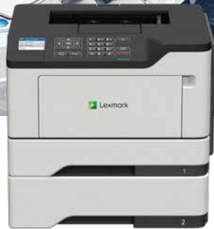
MS521dn mit optionalen Zuführungen

Zuverlässigkeit. Sicherheit. Produktivität.